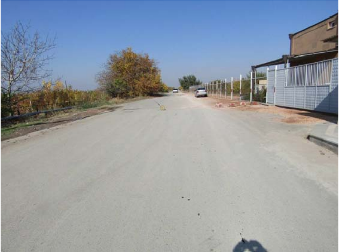
Քայքայված ա/բ պատվածք