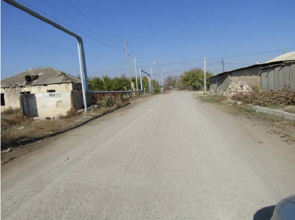
Քայքայված ա/բ պատվածք՝ փոսերով