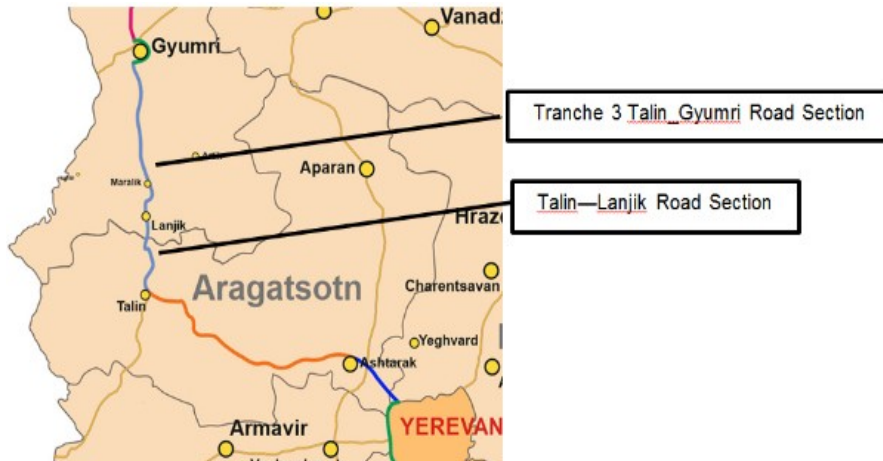
Նկար 1՝ Հյուսիս-հարավ ճանապարհային միջանցի Տրանշ 3